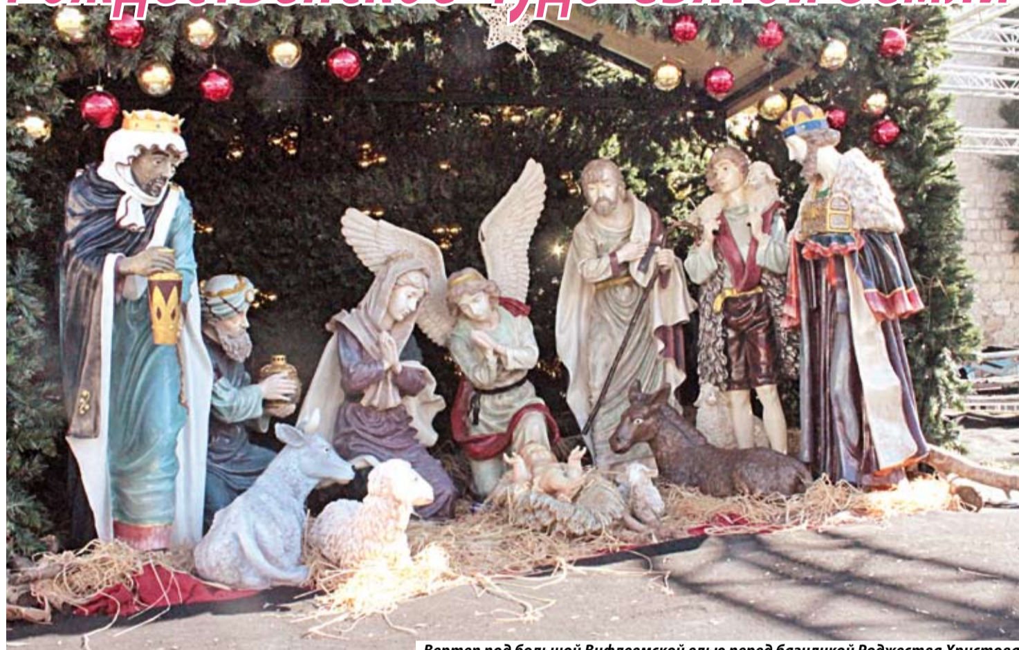
Вертеп под большой Вифлеемской елью перед базиликой Рождества Христова

Рождественский пост в минувшем году для меня был особенным. В начале декабря мне впервые в жизни посчастливилось побывать на Земле Обетованной и увидеть места евангельских событий, где каждый метр – святыня. Базилика Рождества Христова, путь земной жизни Спасителя, Его Крестных страданий, смерти и Воскресения – сердце испытывает здесь совершенно особые чувства.