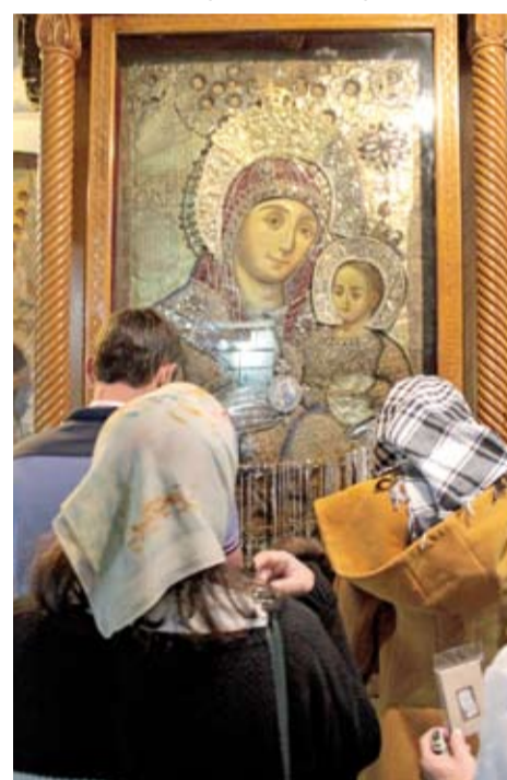
«Вифлеемская» икона Божией Матери

блестящими разноцветными шарами. В храм вел узкий проход, который заставлял каждого входящего низко склонять голову, как бы кланяясь Рожденному Спасителю. В народе эти двери называют