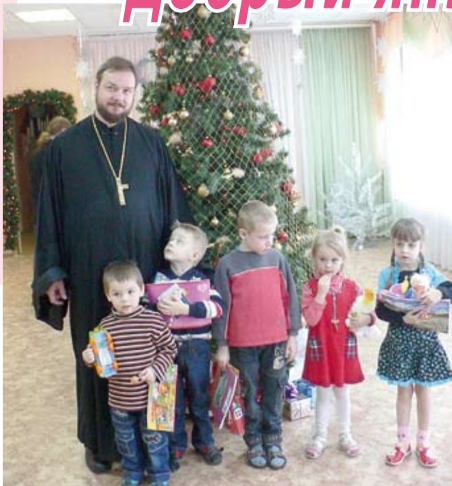
В Центре психолого-педагогической и медицинской помощи детям и подросткам

Примером доброты и бескорыстной помощи для всех христиан вот уже много веков является святой Николай Чудотворец Мирликийский, который в своём родном городе Миры Ликийские в Турции спас от позора трёх сестёр, подкинув в окно в их бедный дом мешочек с деньгами в носке им на приданое. Образ Санта Клауса (в переводе с английского Святого Николая) в России трансформировался в Деда Мороза. Произошло это в годы советской власти, когда иконы святого Николая Чудотворца, так же, как и другие, наши бабушки и прабабушки в основном прятали в сундуках. Но сама традиция дарить подарки на Новый год от Деда Мороза сохранилась. В советские годы в каждом