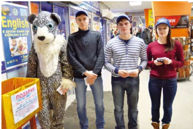
Волонтеры-студенты из Политехнического института собирают подарки в супермаркете «Барс»

учреждении, на фабрике, заводе детям сотрудников выделялись средства на покупку сладких подарков в мешочке, собственно прообразе того, благотворительного носка святого Николая. И преподносил детям эти «сладкие» мешочки Дедушка Мороз на новогодней ёлке.