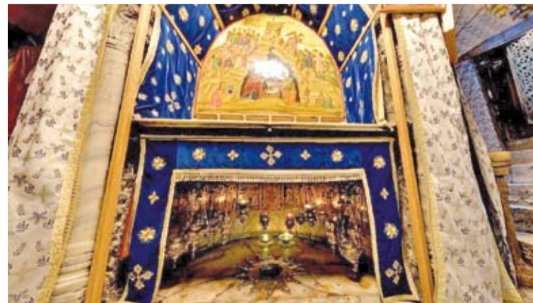
Серебряная звезда, отмечающая место рождения Спасителя