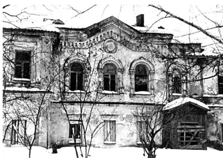
Вид Иоанно-Богословского храма в 1993 году

бора (сегодня оно используется уже для деятельности самого собора).