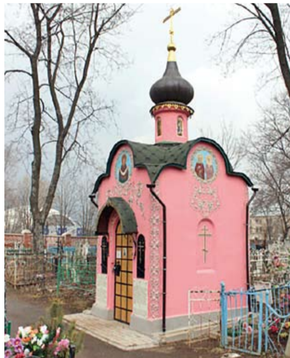
Часовня во имя святой блаженной Любви Рязанской на Скорбященском кладбище г. Рязани