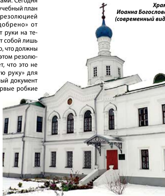
Храм Иоанна Богослова (современный вид)

подселения одинокие пожилые прихожанки Борисо-Глебского собора, проживавшие в Рязани. Особо следует отметить, что среди иногородних учащихся были жители не только Рязанской области. География обширна: это приезжие из Московской, Пензенской, Псковской, Новосибирской, Иркутской областей, из Мордовии, Татарстана, Чувашии, из Украины, Молдавии, Казахстана... В 1992 году владыка Симон добился того, что у училища появилось небольшое общежитие – городские власти передали Борисо-Глебскому собору для училища двухэтажное здание возле со-