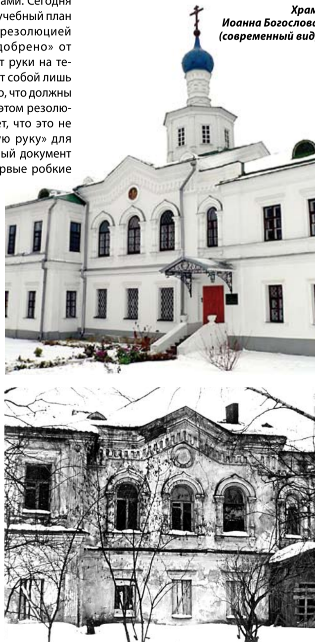
Храм Иоанна Богослова (современный вид)

подселения одинокие пожилые прихожанки Борисо-Глебского собора, проживавшие в Рязани. Особо следует отметить, что среди иногородних учащихся были жители не только Рязанской области. География обширна: это приезжие из Московской, Пензенской, Псковской, Новосибирской, Иркутской областей, из Мордовии, Татарстана, Чувашии, из Украины, Молдавии, Казахстана... В 1992 году владыка Симон добился того, что у училища появилось небольшое общежитие – городские власти передали Борисо-Глебскому собору для училища двухэтажное здание возле со-