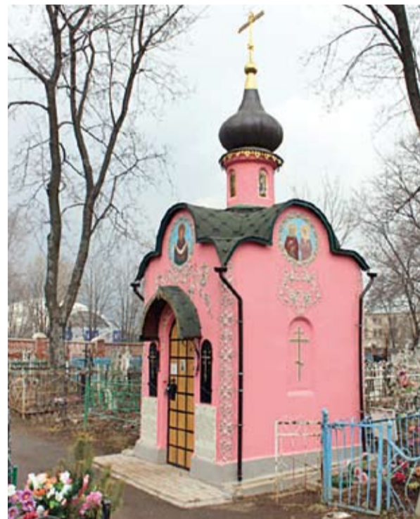
Часовня во имя святой блаженной Любви Рязанской на Скорбященском кладбище г. Рязани