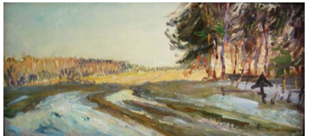
«Борисковский погост», 2015 г.

Одобрено Синодальным информационным отделом Русской Православной Церкви (№ 2 от 22.08.2013 г.)