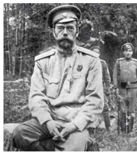
Последнее фото Николая II после отречения

Начавшиеся демократические преобразования охватили и Православную Церковь. В частности, была введена выборность структур церковного управления в епархиях. Впервые за несколько веков верующие получали возможность выбирать себе епископов. В части епархий выборы прошли спокойно, в части возникли проблемы, где «прогрессивное» духовенство и миряне пытались убрать со своих постов неугодных архиереев. В такой ситуации