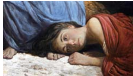
«Христос и грешница», 2011 г.