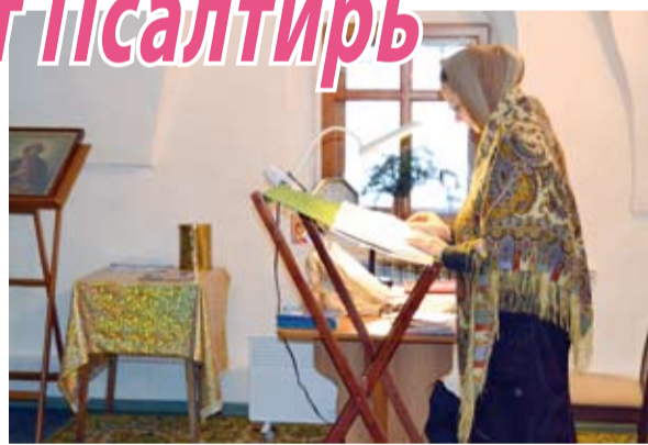
Чтение Псалтири в Солотчинском монастыре

Псалмы являются основанием службы. Они звучат в церкви на всех видах богослужения, исполняемые хором или чтецом. За неделю в храмах Псалтирь, по уставу, прочитывается один раз полностью, а в период