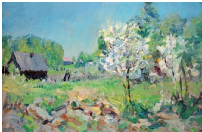
«Весна в деревне», 2015 г.

Выставка «В начале пути» объединила около полусотни работ, как созданных автором в молодые годы, так и написанных недавно. Благодаря такой обширной в хронологическом плане экспозиции зритель мог проследить творческий путь мастера. Художник всегда писал маслом в импрессионистской манере, создавая полотно яркими мазками. Но в картинах 30-летней давности мазки ювелирно акку-