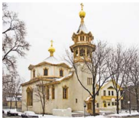
Троицкий кафедральный собор в Чикаго. Современный вид

Иоанн руководил строительством храма как настоящий архитектор и строитель. Возведение храма было завершено в 1903 году. Освятил храм святитель Тихон, будущий Патриарх-исповедник.