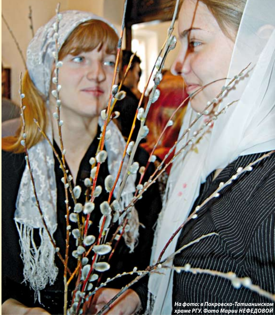
На фото: в Покровско-Татианинском храме РГУ.

Какова была цель торжественного входа Господа в Иерусалим? Почему Ему понадобилось ехать на осле? И при чем здесь вербы?