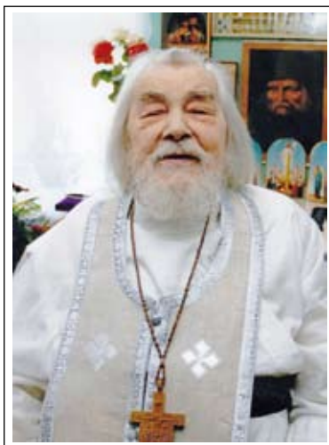
Батюшка благословил меня на терпение, трудную борьбу с грехами. Надо всё выдержать в ней,

Он помогал и мне бороться с грехами, подсказывал, как надо это делать. И борьба эта долгая, будет продолжаться до гробовой доски.