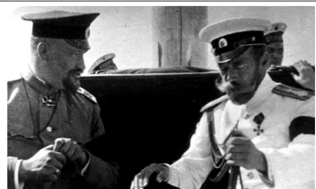
Лейб-медик Евгений Сергеевич Боткин и император Николай II