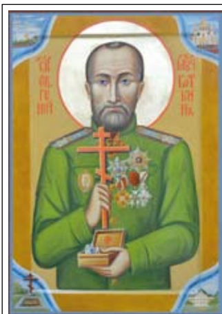
Икона св. страстотерпца врача Евгения Боткина

В последние месяцы жизни Царской семьи вокруг Государя – Царя Николая II – были трусость, измена, ложь. Тех, кто мучил и убивал, – много, и кто предал – много. Но одним из немногих, кто остался верен до конца, был врач Евгений Боткин. Царская семья не осталась в полном одиночестве, и рядом были люди, которые скрасили и разделили с ними страдания и их крест.