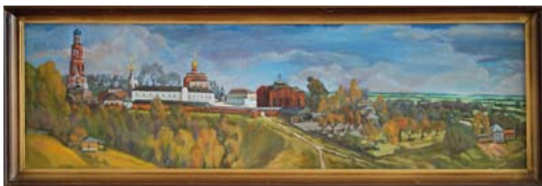
Иоанно-Богословский мужской монастырь, 1990 г., х. м.

Димитриевский мужской монастырь. Начало возрождения» художник написал в 1996 году, трудясь в монастыре на различных строительных послушаниях. Параллельно под