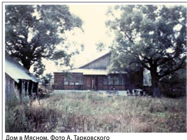
Дом в Мясном.

Андрей Тарковский является Андреем Первозванным мирового кинематографа.