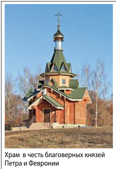
Храм в честь благоверных князей Петра и Февронии