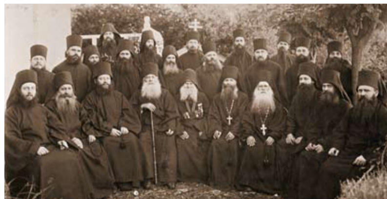
Члены Русского Братства во имя Царицы Небесной на Горе Афонской, нач. XX в.

Возрождаются и утраченные традиции паломничества православных русских людей к святыням русского Афона. 9 сентября 2005 года паломническую поездку сюда совершил Владимир Путин, за 1000-летнюю историю ставший первым руководителем нашей страны, посетившим Святой Афон.