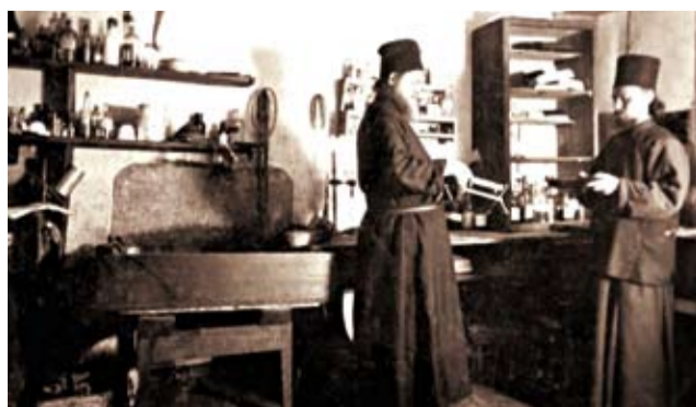
В фотолаборатории Пантелеимонова монастыря, XIX в.

Новый период в жизни Пантелеимонова монастыря