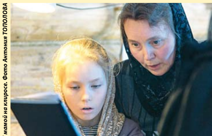
С мамой на клиросе.

PS. Дорогие читатели! Мы ждем ваших вопросов по Священному Писанию. Присылайте их в редакцию на электронную почту blago@mail62.ru , и в следующих номерах попробуем их осветить.