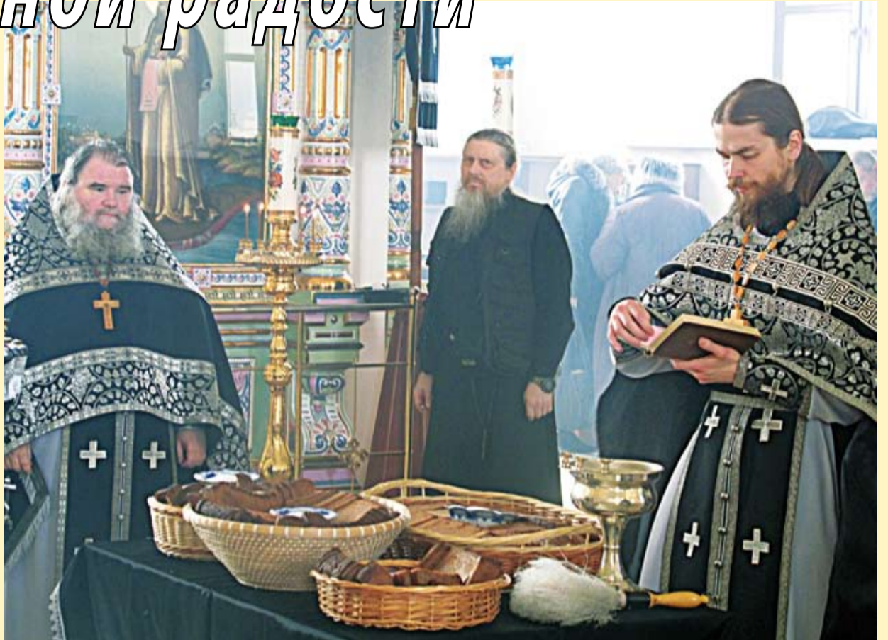
Освящение хлеба и соли в среду первой седмицы Великого поста в Иоанно-Богословском монастыре.