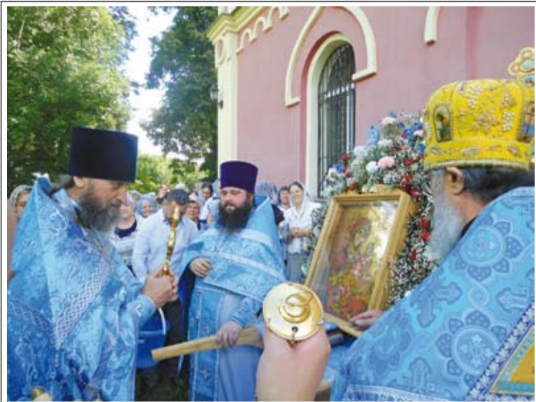
Крестный ход в честь Тихвинской иконы Божией Матери

В каждом уголке нашей страны есть места, через которые не проложены популярные паломнические маршруты, но где находятся древние святыни, удивительные памятники и необыкновенная природа. Одно из таких мест – село Большое Жоково в Рыбновском районе.