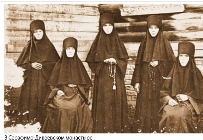
В Серафимо-Дивеевском монастыре

Когда их гнали по этапу в Сибирь, была уже зима. Ехали в неотапливаемых вагонах-телятниках. На каждой станции ночью производили обязательный обыск. Осужденных выстраивали в две шеренги: в одну ставили голых мужчин, а напротив – в нижних рубашках женщин. И так до самого Новосибирска. Среди осужденных были и невинные люди, и уголовники, и шпана, но к матушкам все относились с уважением.