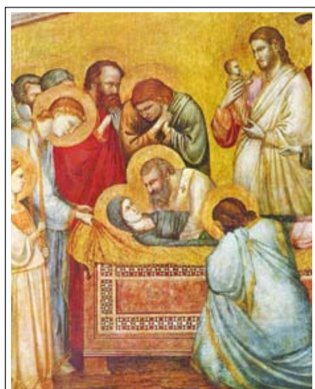
Фрагмент картины Джотто ди Бондоне «Успение Марии», ок. 1310 г.

Любимейшая нами Матерь Божия, наша Заступница Усердная готовится к исходу Своему и вместе с окружавшими Ее учениками Христа ожидает и наших молитв. Но не скорбь, а радость была на Ее лице, когда приняла Она весть о Своем приближающемся Успении от Архангела Гавриила. Как описывается в книге «Земная жизнь Пресвятой Богородицы», «лицо Ее сияло такою небесною радостью, что все присутствовавшие были потрясены при виде Божественной силы и славы, осиявших Ее, и все восколебалось от невидимой Божественной силы, окружавшей Ее». Рыдали и горько плакали, узнав о дне Ее кончины и переселения на Небо, любящие Ее ученики Христо-