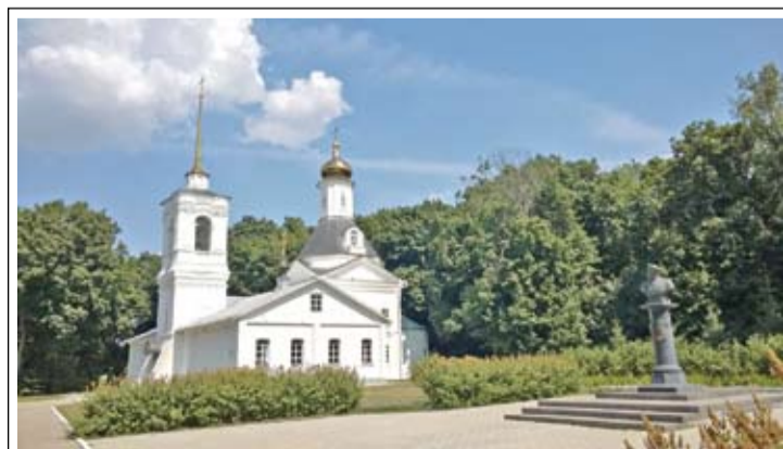
Храм на территории музейного комплекса в с. Заборово