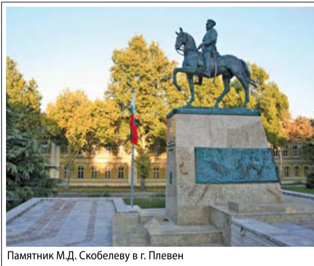
Памятник М.Д. Скобелеву в г. Плевен

...Недавно на телеканале «Спас» в передаче «Следы империи» Аркадия Мамонтова говорили о памятниках – снесенных и сохранных. Один присутствующий высказал мысль, что больше всего ему хочется, чтобы в Москве восстановили памятник Скобелеву. И мне очень бы этого хотелось!