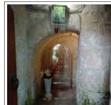
Место убийства благоверного князя Андрея Боголюбского

На следующий день после Литургии, молебна и трапезы мы продолжили знакомство с монастырем. От первоначальных построек XII века в нем сохранилась только одна башня. По Промыслу Божию – именно та, в которой был убит святой князь Андрей Боголюбский. Сейчас эта башня принадлежит музею, и вход в нее платный, поэтому внутрь мы не попали, но нам посчастливилось – была открыта боковая дверка, и мы смогли заглянуть внутрь через решетку и увидеть место убийства святого князя. Это маленькая ниша у подножия каменной лестницы, ведущей сюда из княжеских палат. По этой лестнице раненый князь пытался бежать от своих убийц, но здесь, под лестницей, они настигли его и жестоко с ним расправились.