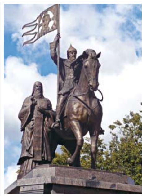
Памятник равноапостольному князю Владимиру и святителю Феодору

ной Церкви причислены сын князя Андрея Боголюбского, святой благоверный князь Глеб Владимирский, и его племянник, святой благоверный князь Георгий. Их мощи также почитают в Успенском соборе.