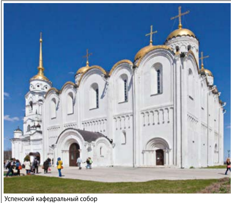
Успенский кафедральный собор

Главным событием этого лета для меня стала паломническая поездка в древнюю Владимирскую землю, организованная Паломническим центром Рязанской епархии.