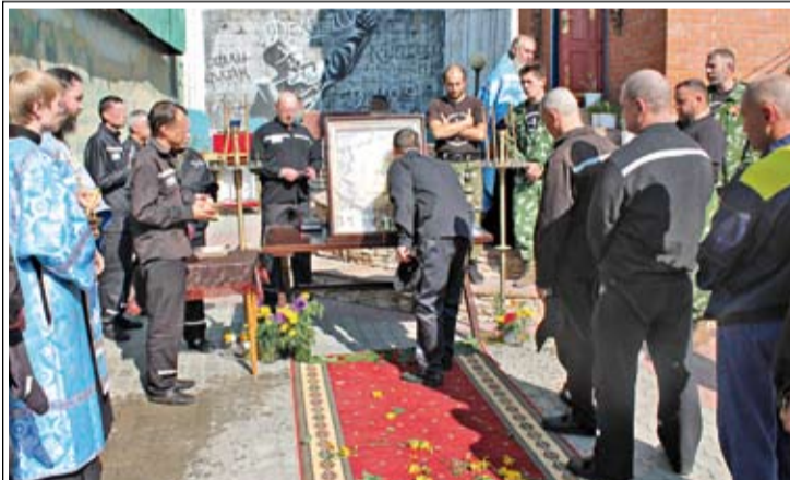
С особым благоговением святыню встретили более 200 осужденных исправительной колонии № 2. Под колокольный звон и с молитвами верующие пронесли икону вокруг храма Покрова Пресвятой Богородицы, расположенного на территории учреждения.

– Да. В этом и сложность: надо подобрать таких ребят, чтобы они были православными и хорошо знали службу. Наши казаки могут петь даже