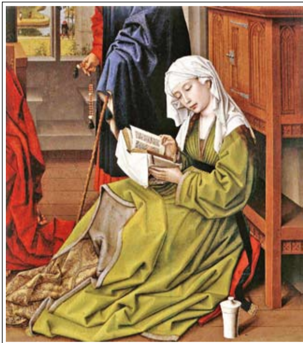
Худ. Рогир ван дер Вейден. «Чтение Марии Магдалины» (фрагмент, 1435–1438 гг.)

– Изначально мне это было просто очень интересно. Я хотела заниматься научными исследованиями, и мне стал открываться целый новый мир. Когда появляется вкус к получению