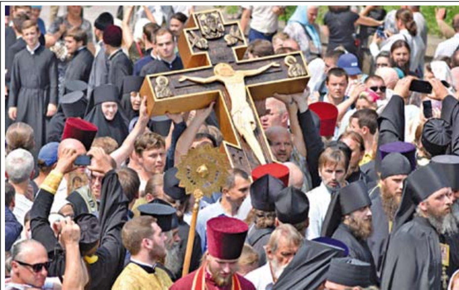
Крестный ход в честь 1030-летия Крещения Руси в Киеве

его жизни, так сразу же появились тенденции к обособлению. В Великой России это была линия Радищева, линия обособления классов с последующей классовой борьбой, а на Украине – линия Шевченко – линия обособления народа с последующей борьбой за самоутверждение.