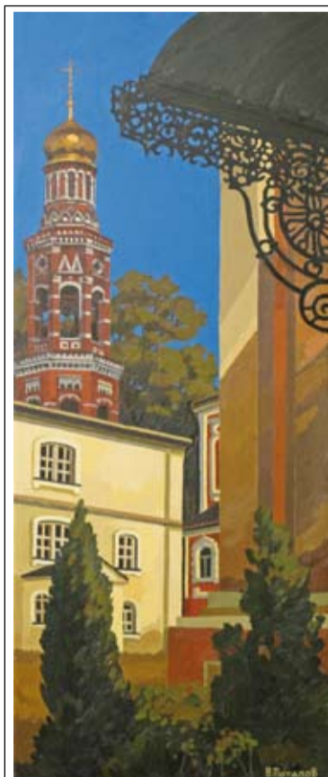
Колокольня Иоанно-Богословского монастыря, с. Пощупово

симова, увидишь много интересного! – рассказывает художник. Красивая местность – лес, реки, озера, и в маленьких деревушках храмы, рассчитанные на несколько тысяч человек, с удивительной архитектурой! Храмы каждый в своем стиле – то барокко, то классицизм. Значит, там люди жили, приглашали архитекторов, а потом на конной тяге везли камень за сотни километров по бездорожью и возводили потрясающие сооружения! А потом в эти храмы ходили семьями. Но даже если от церкви остался один остов – кладешь руку на стену и ощущаешь сопричастность к России и к вере.