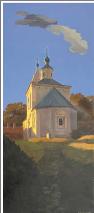
Церковь Илии Пророка, Пронский р-н, с. Абакумово

протоптана тропинка, территория вокруг расчищена, прибрана, внутри стоят иконки... Довольно часто приезжая в те места, где уже были год или два назад, видим разительные перемены: у храма, например, покрыли крышу. Даже если служба еще не идет, он уже не разрушается. Эти церкви простояли много лет, пережили времена безбожия, но не