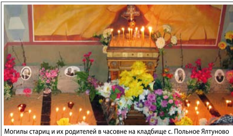
Могила стариц и их родителей в часовне на кладбище с. Польное Ялтуново