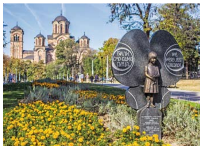
Собор Св. Марка и памятник детям, погибшим в ходе агрессии НАТО на Югославию в 1999 году

Гуляем по улице князя Михаила, ищем музей современного искусства, но никак не можем найти. Проходим мимо соседнего стеклянного помещения в доме, а там – тоже выставка.