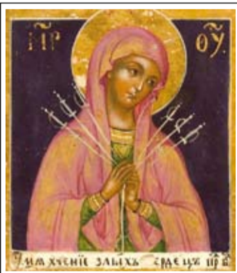
Фрагмент иконы «Нечаянная радость со 120 чудотворными иконами Богородицы», XIX в.

Когда старец Симеон взял принесенного на 40-й день в храм Богомладенца на руки (откуда и появилось название «Богоприимец»), он произнес знаменитые слова, которыми сейчас завершается каждая служба вечерни: «Ныне отпускаеши раба Твоего, Владыко, по глаголу Твоему, с миром...»