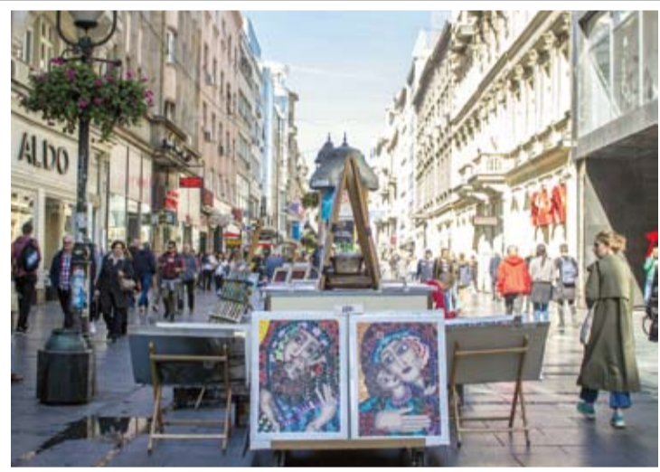
Улица князя Михаила