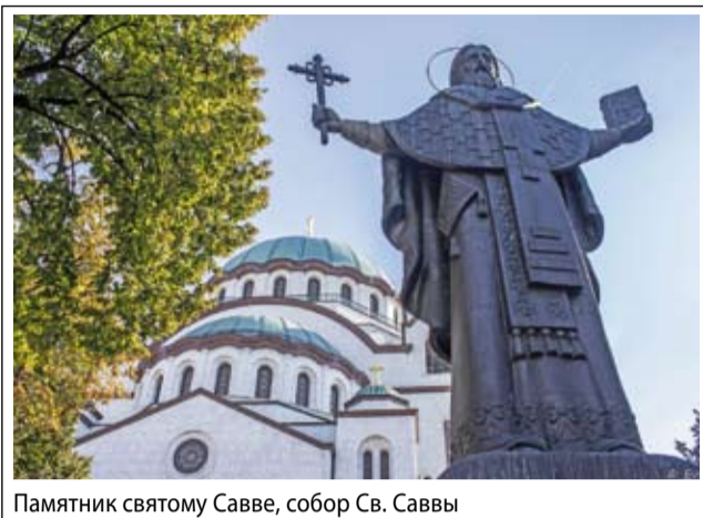
Памятник святому Савве, собор Св. Саввы

Сербия – гостеприимная и дружелюбная страна, особенно для русских. Наши теплые отношения с ней подтвердились на государственном уровне визитом нашего президента В.В. Путина. Визит президента здесь был воспринят как историческое событие. Президент Сербии Александр Вучич лично встречал главу Российского государства. После возложения цветов к монументу освободителям Белграда, переговоров и нескольких приемов сербский народ ждал Путина перед храмом Святого Саввы. Здесь Патриарх Сербский Ириней главе нашего государства вручил орден Святого Саввы – высшую награду Сербской Православной Церкви.