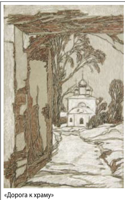
«Дорога к храму»