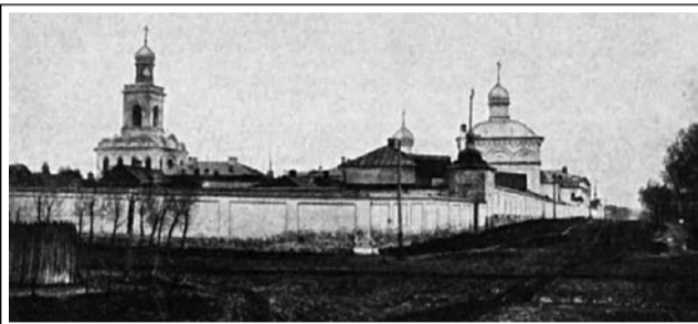
Казанский женский монастырь. Фото ок. 1910 г.

В Казанском Явленском девичьем монастыре после 1917 года за первые два года было реквизировано все, что можно было изъять. Из обители вывозили церковную утварь, облачения, иконы и даже колокола. Как вспоми-