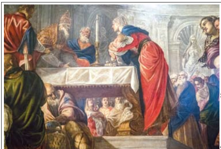
«Сретение Господне», Тинторетто. Венеция

на свои руки и являющего собою как бы ветхий мир, и Мать Божию, вышедшая на крестный путь – отдавание Сына Своего на спасение мира. И вся икона в своем построении выражает эту двойственную природу праздника, радость Сретения и Страстную