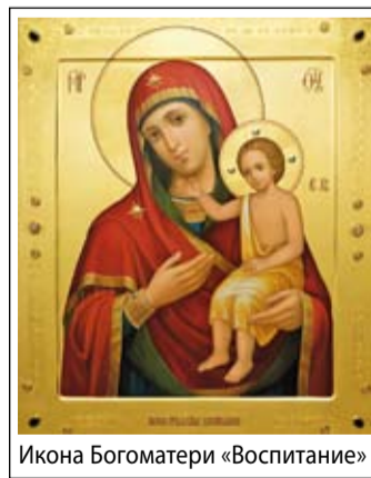
Икона Богородицы «Воспитание»

Иконография образа Божией Матери «Воспитание» по своему иконописному типу относится к «Одигитрии» (т.е. «Путеводительнице», которая указывает путь). Утонченность палитры делает этот образ, на котором иконописцу удалось передать внутреннюю духовную красоту Пресвятой Богородицы, особо светлым. Мать Божия изображается на иконе с Предвечным Младенцем, сидящим на Ее левой руке. Правая рука Христа (на некоторых образах – две руки) простерта вверх к лику Пречистой Девы. Сама Богородица одета в темно-красный мафорий. Отрок Христос одет в золотой гиматий (прообраз плащаницы), спадающий с Его плеч, – без хитона. Плоть Сына Божия и есть риза Его, хитон нешвенный. Прекрасна Мать Христова. Святой лик Богородицы наполнен любовью, Ее нежность распространяется не только на Сына, сидящего на Ее руке, но и на все человечество.