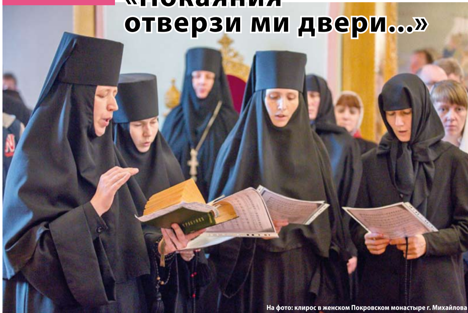
На фото: клирос в женском Покровском монастыре г. Михайлова

состояние внутренней собранности, смирения, тишины со стороны страстей и молитвенного устремления к милосердию Божию. В Неделю о мытаре и фарисее также начинается пение и других текстов из Постной Триоды. В составлении этих песнопений потрудились знаменитые святые отцы и учителя Церкви: преподобные Феодор и Иосиф Студиты, святители Анатолий Константинопольский, Косма Маиумский, Андрей Критский и многие другие песнотворцы. И нет ничего для их пения лучше наших древних церковных напевов.