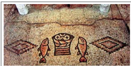
«Умножение хлеба и рыб», мозаика (Табха, Израиль. IV в. н. э.). насыщение пяти тысяч человек пятью хлебами и двумя рыбами широко употреблялось как образ Евхаристии.