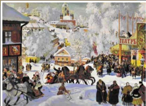
Кустодиев Б.М. «Зима. Масленичное гулянье». 1919 г.

из названия, печенье придают крестообразную форму. Часто из изюма или цукатов на перекладинах делали «гвоздочки», а сами перекладинки поливали сахарной глазурью. «Кресты» были полны угощением в этот день.