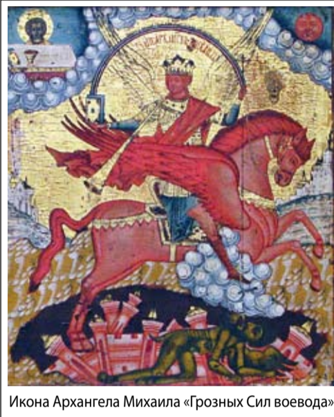
Икона Архангела Михаила «Грозных Сил воевода»

– Кажется, на каждой лекции вы упоминали рублевскую «Троицу». Сразу и не скажешь, что в ней столько скрытых смыслов!