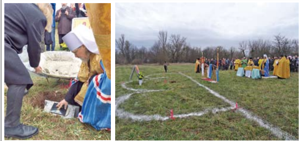
Закладка храма в честь иконы Божией Матери «Живородный источник» в г. Хевизе

Действительно, Хевиз – это очаровательный европейский городок со всеми атрибутами оно: аккуратными улочками, цветочными клумбами, уютными кафе. Но центр всеобщего притяжения – одноименное термальное озеро, крупнейшее не только