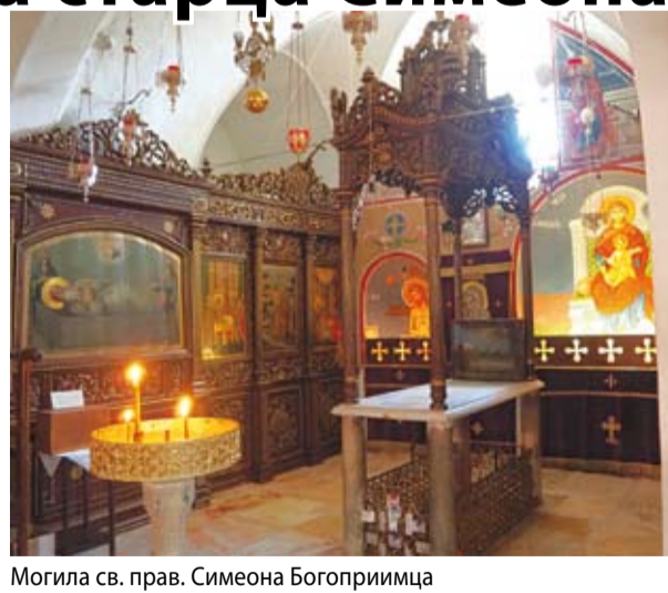
Могила св. прав. Симеона Богоприимца

Возникла обитель в конце XIX века усердием греческого монаха Авраамия. Из предания он знал, что на юго-западе Иерусалима в евангельские времена стоял дом праведного Симеона, где-то здесь должен находиться и семейный склеп, в котором был погребен старец, называемый