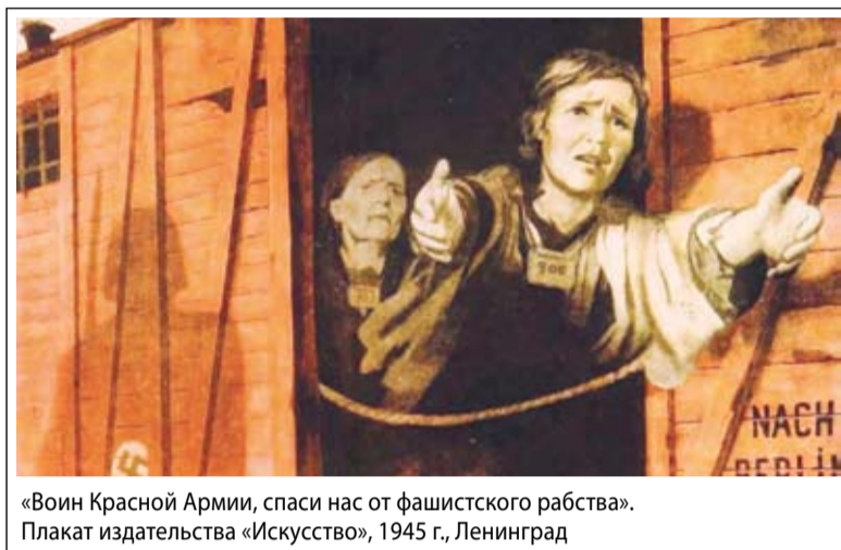
«Воин Красной Армии, спаси нас от фашистского рабства». Плакат издательства «Искусство», 1945 г., Ленинград

Грязные, худые, голодные, они жили одним днем, не загадывая на завтра. Главное, чтобы при обходе не заметили вшей, потому что немцы боялись тифа и подозрительных сразу «выбраквывали», то есть