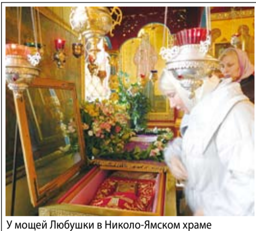
У мощей Любушки в Николо-Ямском храме