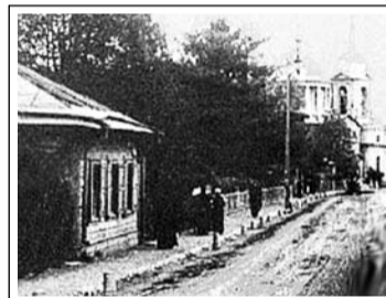
Улица Затинная. Фото до 1910 г.

По всей Рязани ведет нас Любушкина тропинка от красиво расписанной часовни над ее могилой, с места ее упокоения, к домику на улице Затинной, к месту, где жила Любушка с родными. На месте ее дома стоит другой – с мемориальной доской в память о ней. Рядом находился дом священномученика владыки Иувеналия, расстрелянного в Томске в 1937 году. А через дорогу, на территории Благовещенского храма, в 2014-м возведена часовня с источником святой блаженной Любви в исполнение ее слов, сказанных строителям дома (к которым она явилась видимым образом сама в 1999 году): «Вы строите дом на святом месте, а во дворе – святой колодец».