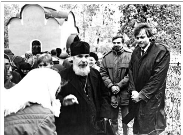
Архимандрит Авель у часовни блаженной Любви Рязанской

12 января 1987 года благодаря усердию архимандрита Авеля Любовь Семеновна Сухановская была причислена к Собору Рязанских святых как местночтимая святая – блаженная Любовь Рязанская. День ее памяти установлен 8/21 февраля – в день преставления и 10/23 июня – в день празднования Собора Рязанских святых.