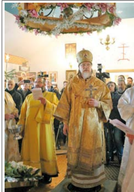
Чин великого освящения храма в честь Пресвятой Троицы в г. Дебрецене

– Мы рады, что правительство Венгрии, премьер-министр и члены кабинета поддерживают в целом христианские ценности,