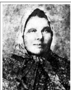
Прижизненное фото Любви Рязанской. На левой стороне снимка есть надпись: «Блаженная девица Любушка»

«Наша Любушка», «Наша помощница», «Любушка – Божья голубушка» – так сердечно, по-простому называют рязанцы святую блаженную Любовь Рязанскую. И на прижизненной фотографии она выглядит девицей-голубицей. Проста и наивна, похожа на благочестивую крестьянку.