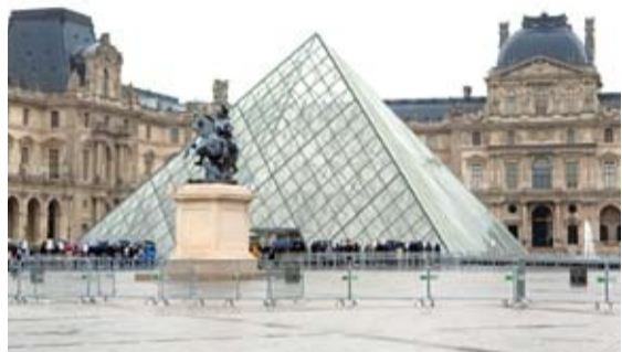
Стеклянная пирамида у входа в Лувр

приобрел свой незабываемый облик. Стоит отметить, что его бережно сохраняют сегодня: запрещено строить дома выше четырех этажей. Более того, если кто просто вывесит сушильщицу белье на балкончике, придется заплатить большой штраф.