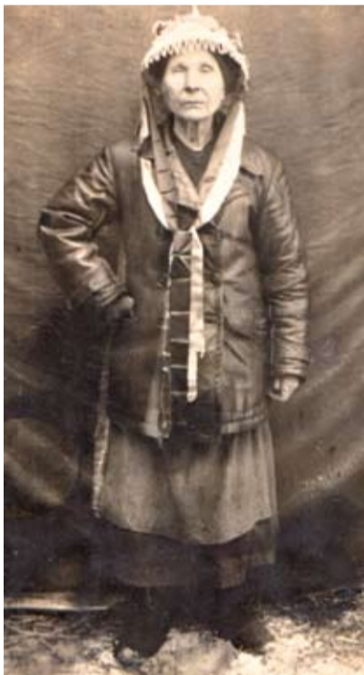
На фото начала XX в. – неизвестная юродивая Шацкого района